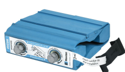
ウェッジおよびウェット